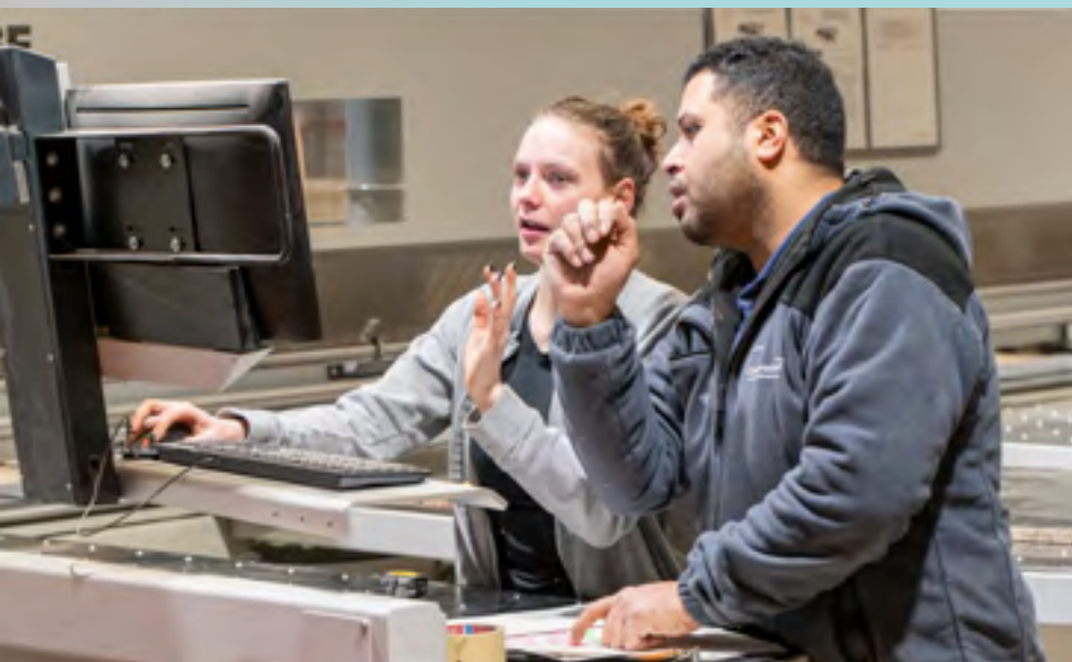
Het machinepark is uitgerust voor een brede waaier aan opdrachten.

Constructief wil deze troeven nu uitgebreid uitspelen. Er waren in de voorbije periode al concrete contacten en projecten en de bedoeling is dat deze aanpak verder zijn vruchten afwerpt. Een nieuwe website, met aparte pagina’s voor particulieren en voor bedrijven, licht de diverse mogelijkheden toe. En meer activiteit op sociale media zal de nieuwe strategie mee in de markt helpen zetten.