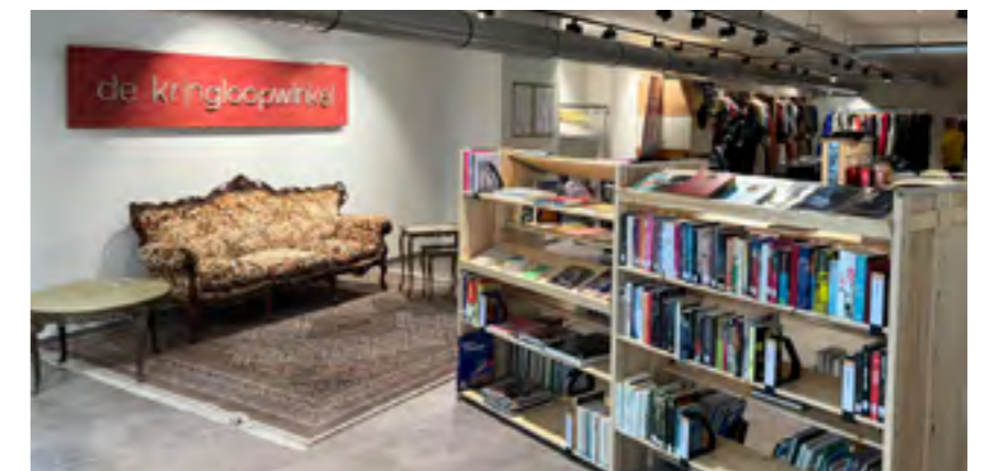
Deze mooie tijdelijke winkel in het centrum van Waregem verkocht naast kledij ook boeken.