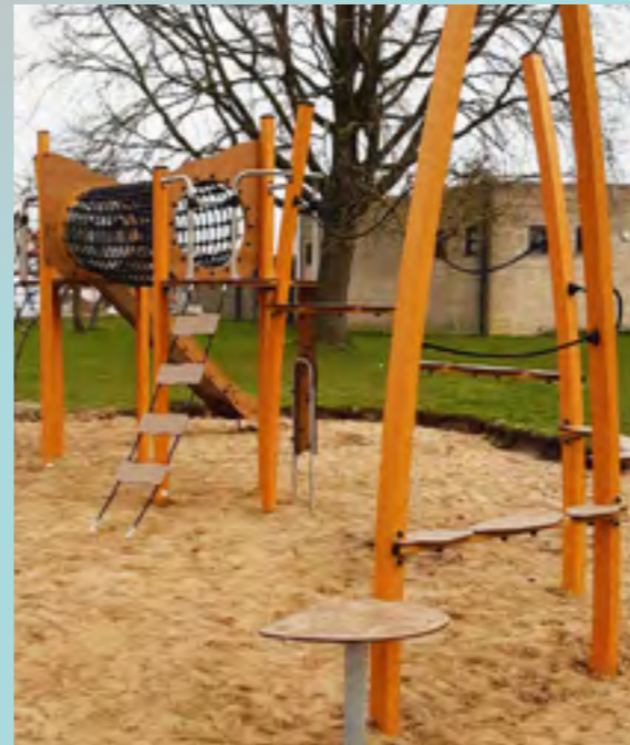
Plaatsing speeltuig in het Hondiuspark te Wakken.

Het onderzoek leidde tot een aanbeveling om onze communicatie aan te passen, en de focus van het vroegere ‘interieur en schrijnwerk’ te verbreden. Het produceren van (beperkte) series en plaatsingsopdrachten moeten ook in beeld komen.