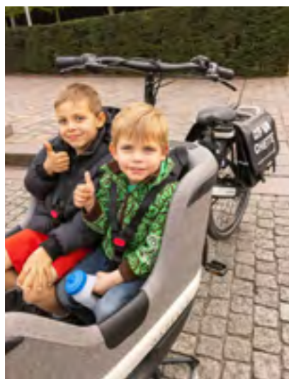
Kindjes in een testkaravaan bakfiets.