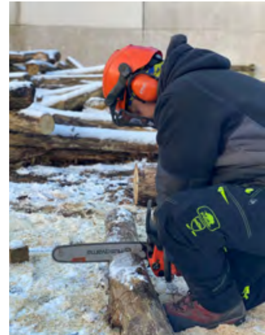
Eerste stap is hout op de grond veilig doorzagen.

Deze vorming is een zogenaamde ECS opleiding, wat staat voor 'European Chainsaw Standard'. Kortom, een Europees gestandaardiseerde en degelijke opleiding.